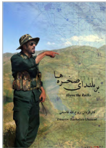
پوستر فیلم مستند «بریلندای صخره‌ها»